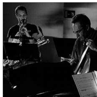
El festival se inicia hoy con V. Sonora.

Vigo acoge desde hoy y hasta finales de noviembre el festival Vertixe, una ventana a la música contemporánea y experimental a través de 20 conciertos y talleres. La apertura tiene lugar hoy en Espacio Sirvent (Gran Vía, 129), a las 20.30 horas con la actuación de la compositora rusa Marina Poleukhina, Vertixe Sonora Ensemble y trasPiedante de danza. El festival es una iniciativa de Vertixe Sonora Ensemble y el Instituto Galego de Sonoloxía. Ambos llenarán este otoño de actuaciones especiales en diversos espacios de la ciudad. La programación, en www.vertixevigo.net .